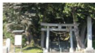
静岡県指定文化財(第599号)