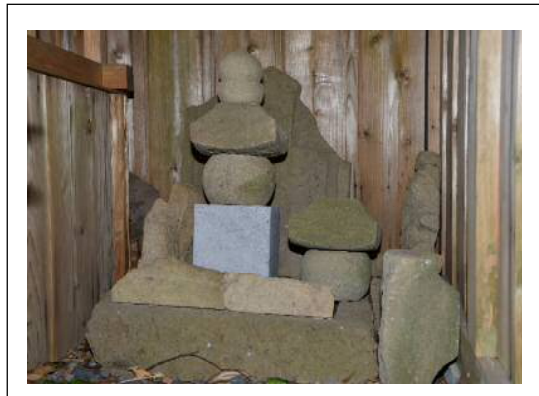
五輪塔（地輪は後補）と石廟残欠