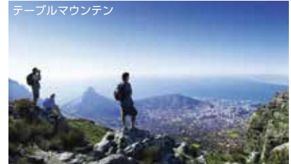
テーブルマウンテン