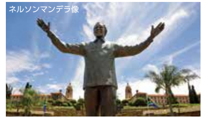
ネルソンマンデラ像