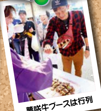
夢味牛ブースは行列