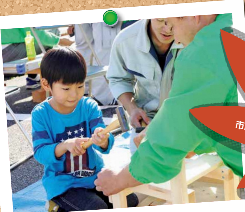
建築の仕事体験 イスづくり