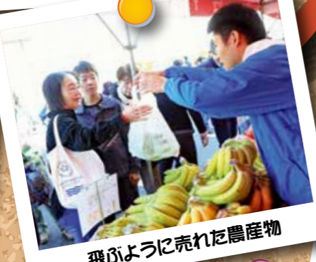
飛びように売れた農産物