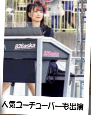
人気コーチューバーも出演