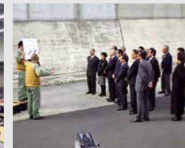
▲海拔22m防波壁の説明を受ける