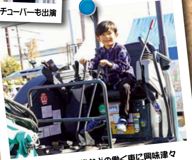
子どもたちは重機などの動く車に興味津々

本市の一大イベント「御前崎市大産業まつり」が、11月23日と24日の2日間にわたり市役所周辺で開催されました。今回で15回目。 イベントは、出店者が商品を販売、展示することにより、それぞれの商品や取り組みを来場者やイベント参加者に知ってもらうことがねらいで毎年開催されています。 今年は130店が出店。ウチのお店はこんな商品も売ってるんですよ」といった商品や仕事を紹介する会話や呼び込みの声が聞かれました。