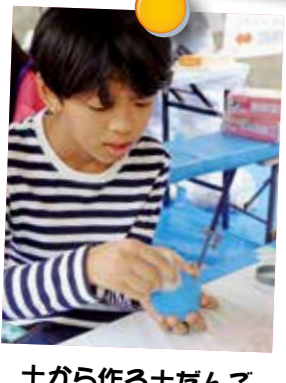
土から作る土だんご