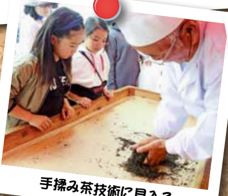
手揉み茶技術に見入る

市内の各産業が一堂に会し、市内外へ自社の魅力を発信した2日間をフォトレポートします。