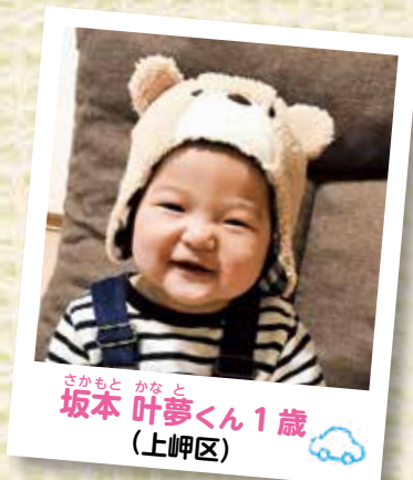
坂本 叶夢くん1歳 (上岬区)