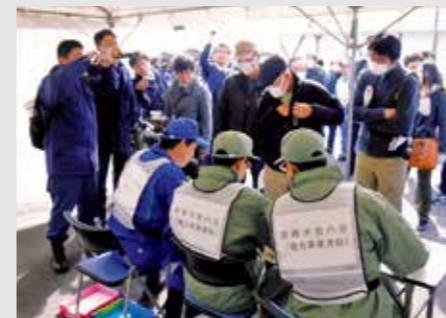
▲避難経路所で避難所を振り分ける

御前崎市原子力災害広域避難計画では、原子力災害が単独で発生した場合の避難先を浜松市、大規模地震との複合災害などで浜松市に避難できない場合の避難先を長野県に設定しています。現在、避難先の市町村を確定させるため、関係機関と調整を行っております。 自家用車による避難を原則としていますが、それが困難な人は、市内8カ所に設置する一時集合場所から、市が準備したバスに乗り避難をすることになります。 避難する際には、避難退域時検査場所を通過し、あらかじめ定められた避難先市町村の避難経路所に向かいます。そこで避難者名簿の作成や避難所の振り分けをします。避難所の振り分けは、町内会単位を基本とし、地域コミュニティが確保できるように検討しています。 現在、長野県内の避難経路所が確定していないことや避難経路での燃料確保、降雪対策などさまざまな課題が残っています。市では引き続き、検討および関係機関との協議を重ね実効性向上に努めます。長野県の避難経路所が確定した時点で、利用する避難経路所を市内在り会ごとの割り振りなどを市民の皆さまに周知する予定です。