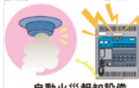
自動火災報知設備