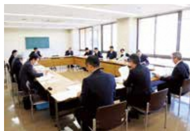
▲幹部職員が集まり候補エリアを協議

をもつ重要な施設です。1日も早く新火葬場が整備できるよう市民の皆さまのご理解とご協力をお願いいたします。