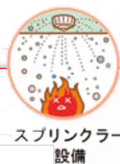
スプリンクラー設備