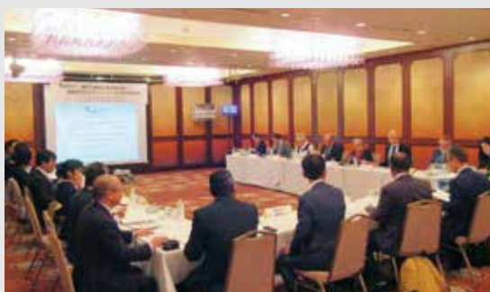
▲意見交換会のようす

出席し、それぞれの立場から当時の状況や思いについて発言しました。海外の各代表者からは、原子力事業では、信頼関係の構築や情報の透明性、継続的な対話が必要といった意見が上がりました。