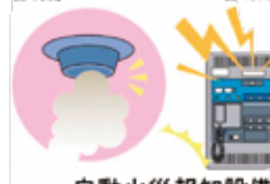
自動火災報知設備