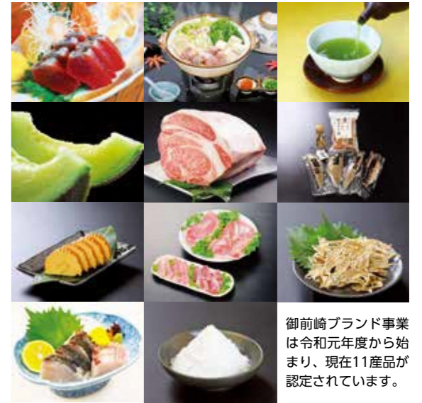
御前崎ブランド事業は令和元年度から始まり、現在11産品が認定されています。

事業者などの経験や実績、事業システム全体から判断し、本市のイメージ向上への貢献が期待できるか