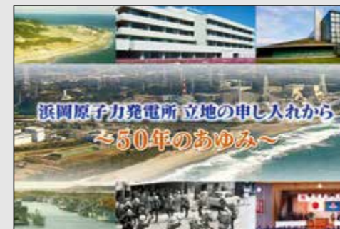
▲動画「50年のあゆみ」のサムネイル

市は、これまで浜岡原子力発電所と共存し発展してきた歴史を風化させず、次世代に伝えていくことを目的に、50年の歩みを動画にまとめました。動画は、①浜岡原子力発電所立地の経緯、②御前崎市の発展、③現在の原子力発電所の状況の3部構成となっています。 ①では、立地の経緯や市の対応など、立地に携わった元職員の話や交えながら詳しく説明しています。②では、発電所の固定資産税による税収の増加や電源三法交付金などを活用したまちづくりの様子、財政規模や人口の推移などをグラフを使ってわかりやすく説明しています。③では、東