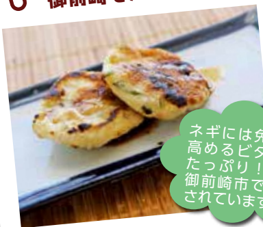
みたらし風ネギもち

ネギには免疫力を 高めるビタミンが たっぷり！ネギは 御前崎市でも生産 されています。