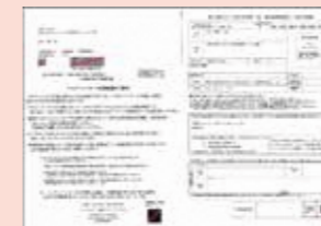
送付状・交付申請書