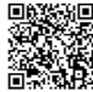
▲特設ホームページ 二次元コード

静岡県は海も山もある自然豊かな県です。そして、私が住んでいる御前崎市には美しい景観で知られる浜岡砂丘があります。しかし近年、流木やプラスチックごみなどの影響で美しいとは言えなくなってきました。また、遠州灘から吹き付ける強風や高波の影響で砂浜が毎年浸食されてきています。市内の自然としてだけでなく、美しい静岡県の自然としてさまざまな問題に目を向ける時だと考えています。