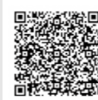
▲市ホームページ二次元コード