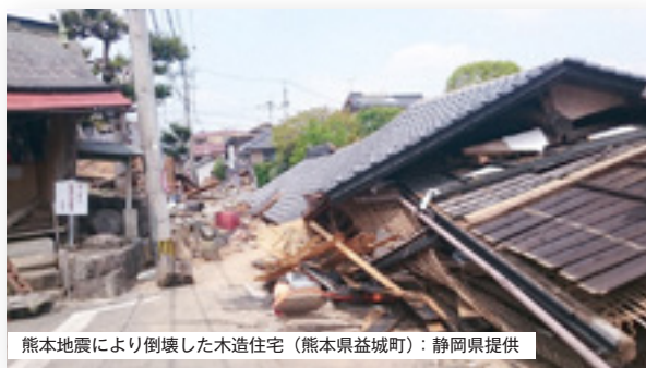
熊本地震により倒壊した木造住宅（熊本県益城町）