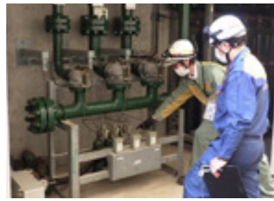
▲浜岡原子力発電所内の二酸化炭素消火設備を調査している様子

に対し、事故の予防対策と注意喚起を行っています。 照会 消防署 ☎0537(85)2119