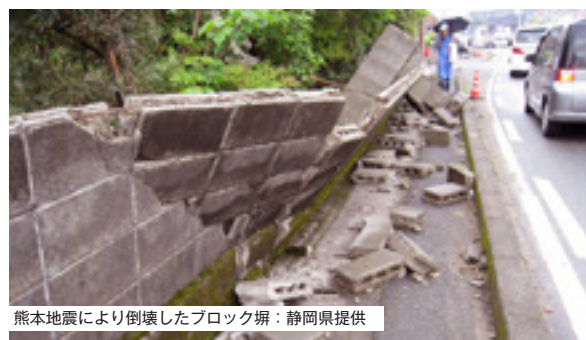
熊本地震により倒壊したブロック塀：静岡県提供

※補助の対象となる住宅・ブロック塀には条件があります。詳細については照会先へお問い合わせください。