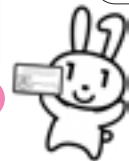
こっちが マイナンバーカード