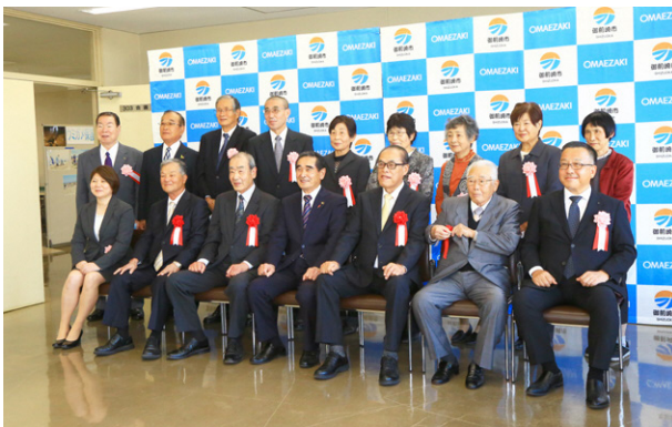
▲表彰・感謝状を受賞された皆さん