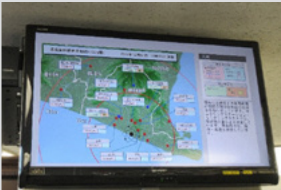
▲市役所本庁舎1階ロビーに設置されているモニター

モニタリングステーションでは、浜岡原子力発電所周辺の空間放射線量を測定しています。空間放射線量とは空間を飛び交っている放射線のことで、宇宙から降り注いでくる放射線や大地、大気からの放射線などがあります。測定は24時間連続で行われており、周辺環境を常時監視しています。測定データは、市役所などに設置されているモニターでいつでも確認することができます。