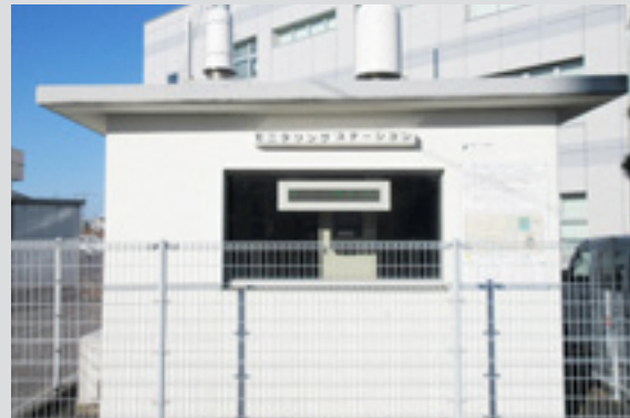
▲市役所西館横に設置されたモニタリングステーション