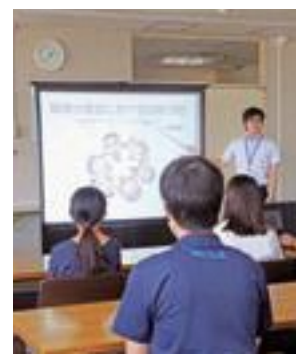
▲市が開催した養成講座