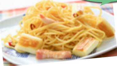
焼きネギのペペロンチーノ