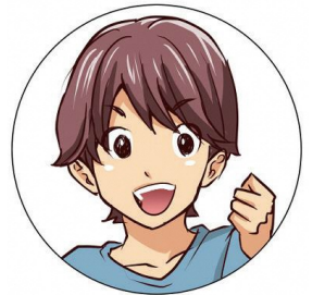
双子の兄 小学4年生