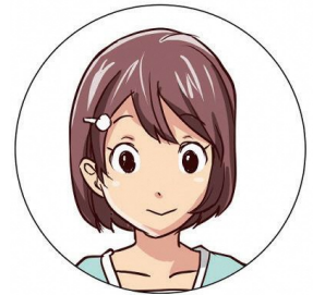
双子の妹 小学4年生