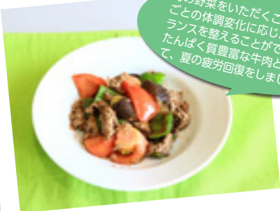
夢咲牛の夏野菜炒め

旬の野菜をいただくことで季節ごとの体調変化に応じ、体のバランスを整えることができます。たんぱく質豊富な牛肉とあわせて、夏の疲労回復をしましょう。