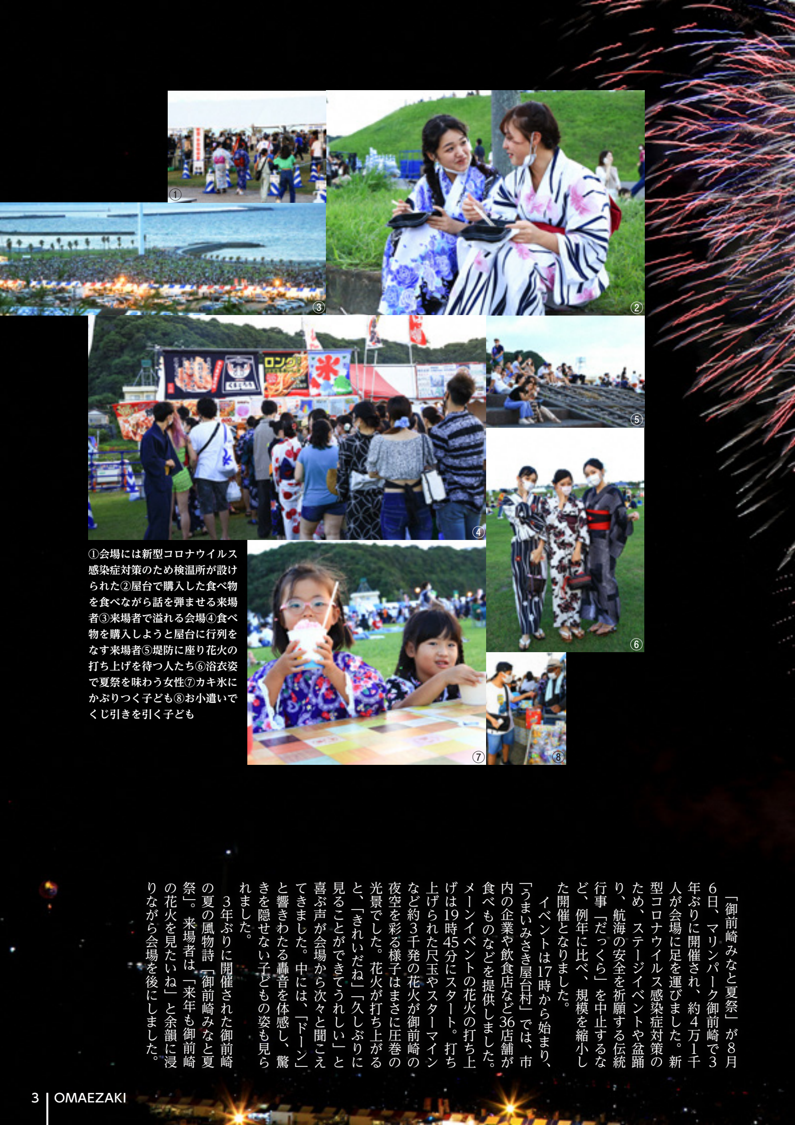
①会場には新型コロナウイルス感染症対策のため検温所が設けられた②屋台で購入した食べ物を食べながら話を弾ませる来場者③来場者で溢れる会場④食べ物を購入しようと屋台に行列をなす来場者⑤堤防に座り花火の打ち上げを待つ人たち⑥浴衣姿で夏祭を味わう女性⑦カキ氷にかぶりつく子ども⑧お小遣いでくじ引きを引く子ども

「御前崎みなと夏祭」が8月6日、マリンパーク御前崎で3年ぶりに開催され、約4万1千人が会場に足を運びました。新型コロナウイルス感染症対策のため、ステージイベントや盆踊り、航海の安全を祈願する伝統行事「だっくら」を中止するなど、例年に比べ、規模を縮小した開催となりました。 イベントは17時から始まり、「うまいみさき屋台村」では、市内の企業や飲食店など36店舗が食べものなどを提供しました。メインイベントの花火の打ち上げは19時45分にスタート。打ち上げられた尺玉やスターマインなど約3千発の花火が御前崎の夜空を彩る様子はまさに圧巻の光景でした。花火が打ち上がるのと、「きれいだね」「久しぶりに見ることができてうれしい」と喜ぶ声が会場から次々と聞こえてきました。中には、「ドーン」と響きわたる轟音を体感し、驚きを隠せない子どもの姿も見られました。 3年ぶりに開催された御前崎の夏の風物詩「御前崎みなと夏祭」。来場者は「来年も御前崎の花火を見たいね」と余韻に浸りながら会場を後にしました。