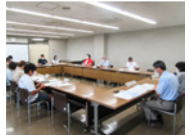
▲7月21日に開催された 第1回策定協議会の様子

今回、市内の協働に対する理解を図るため、協働の知識やルールをまとめた「御前崎市市民協働の指針」を策定することとなりました。9月に開催する第2回策定協議会を経て、パブリックコメント(意見公募)を実施します。たくさんのご意見をお待ちしています。詳細は市ホームページをご覧ください。