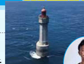
ジュマン灯台(フランス)