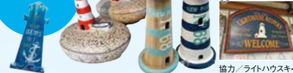
協力 / ライトハウスキーパー