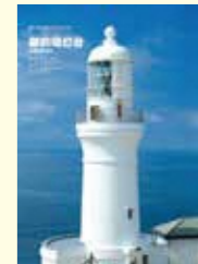
御前埼灯台(静岡県)