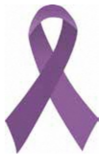
パープルリボン パープルは、女性に対する暴力根絶のシンボルカラーです。

日時 月・水曜日 9時15分～17時(祝日は除く) 照会 市女性相談ダイヤル ☎0537②8730