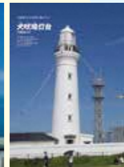
犬吠埼灯台(千葉県)