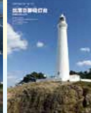
出雲日御崎灯台(島根県)