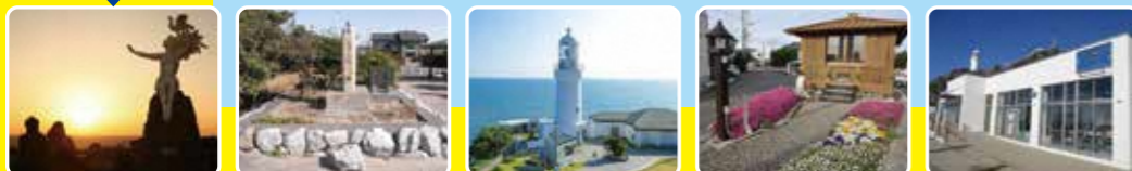
①潮騒の像 ②ねずみ塚 ③御前埼灯台 ④見尾火燈明堂 ⑤御前崎 渚の交番