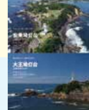
安曇崎灯台・大王埼灯台(三重県)