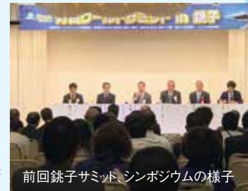
前回銚子サミット、シンポジウムの様子