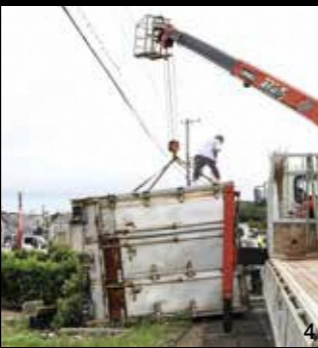
1.ビニールハウスが直撃した住宅/2.突風により吹き飛ばされて原形をとどめていないソーラーパネル/3.24日にがれきなどの撤去作業をした市役所職員/4.吹き飛ばされたトラックのコンテナを回収する業者/5.突風により約10m移動し倒れたごみ集積所