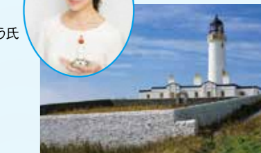
マル オブ ギャロウエー灯台(スコットランド)