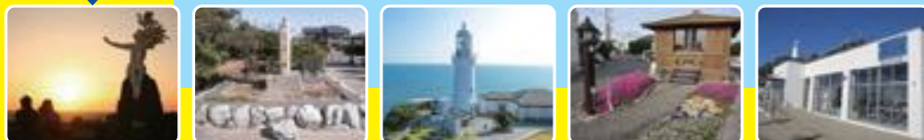
①潮騒の像 ②ねずみ塚 ③御前埼灯台 ④見尾火燈明堂 ⑤御前崎 渚の交番