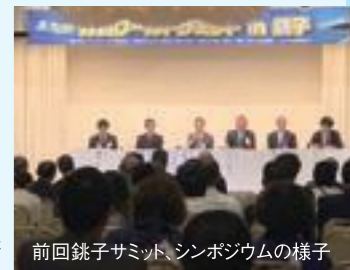
前回銚子サミット、シンポジウムの様子