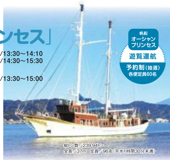
帆船 オーシャン プリンセス