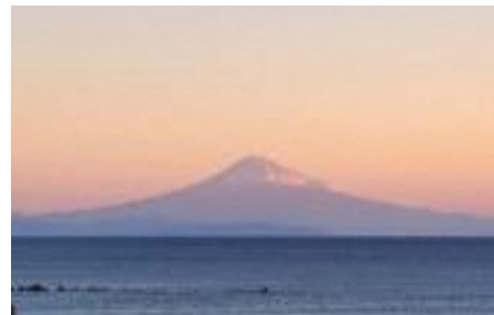
▲今年の初日の出直後にマリパーク御前崎から撮影

富士山は空気が澄んだ朝の景色がより美しいので、御前崎市を訪れる皆さまにはぜひ御前崎市に泊まっただき、翌朝、この眼福を味わっていただけたらと思います。