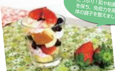
イチゴとカステラのトライフル

旬のイチゴはビタミンCたっぷり！肌や粘膜の潤いを保ち、免疫力を高めて身体の調子を整えましょう。