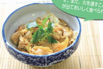
長ネギと車麩の卵とじ

長ネギは殺菌効果のある薬味や魚・肉のにおい消しにも使えます。また、火を通すことで甘みが出ておいしく食べられます。