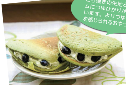
つゆひかりどら焼き

どら焼きの生地とクリームにつゆひかりが入っています。よりつゆひかりを感じられるおやつです。