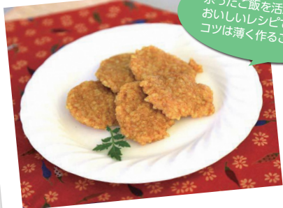
ご飯 de カレーせんべい