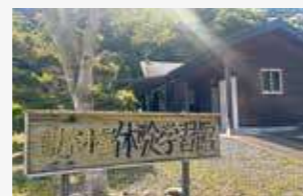
◀観察小屋(体験学習館) ▼小屋から見える景色

NPO法人Earth Communicationの代表理事を務める。持続可能な環境や社会づくりに寄与することを目的とし、さまざまなプログラムを実施している。