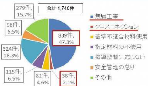
図1 違反行為の内訳※複数回答分を含む