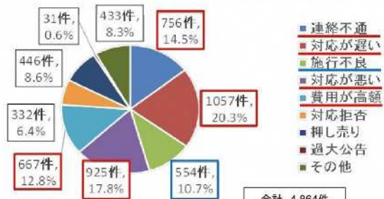
図2 苦情の内訳※複数回答分を含む