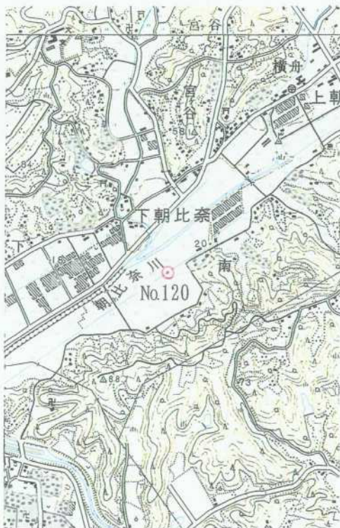
1/25,000 御 前 崎