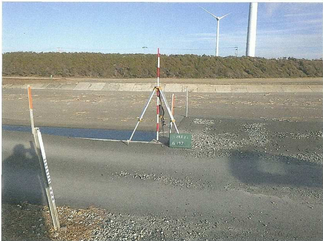
3級基準点 No. 197 遠景