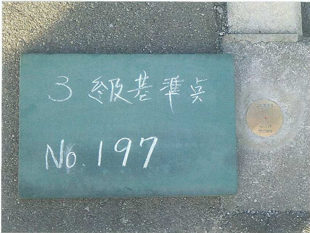
3級基準点 No. 197 近景