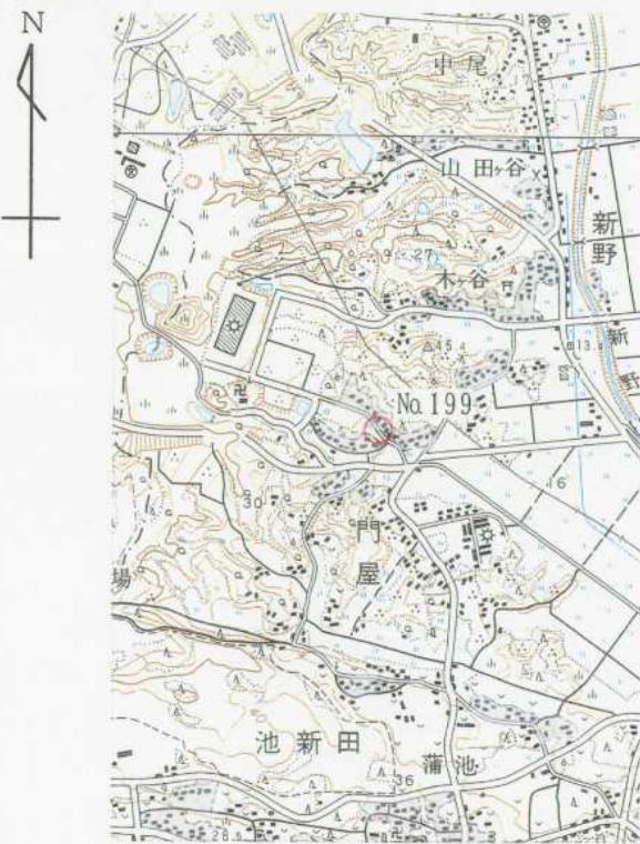
1/25,000 千 浜