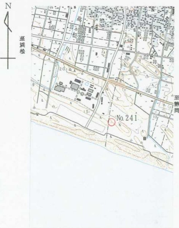
1/25,000 千 浜