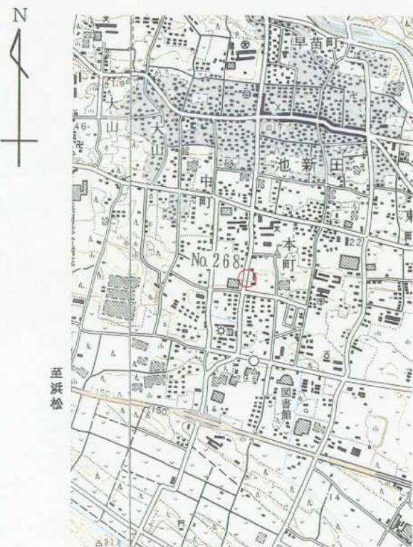
1/25,000 御 前 崎