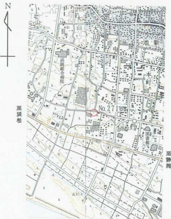
1/25,000 御 前 崎