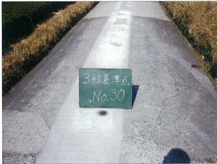
NO. 30 近景