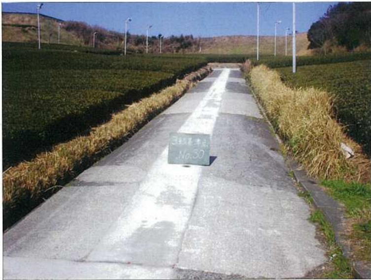
NO. 30 遠景 2007年 3月17日撮影