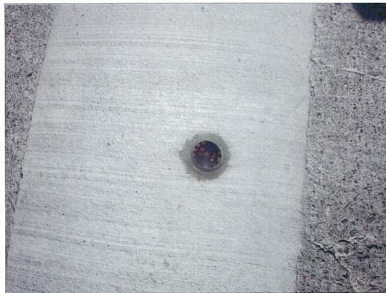
NO. 30 金属標