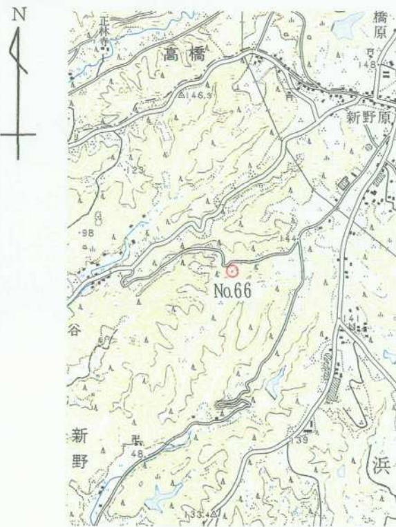
1/25,000 相 良