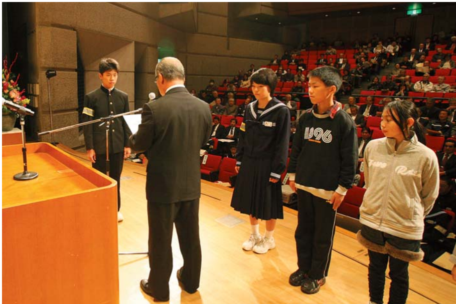
標語と作文で表彰される生徒、児童