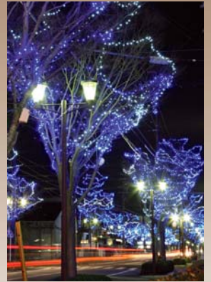
きらめく市道が復活 商工会のイルミネーション