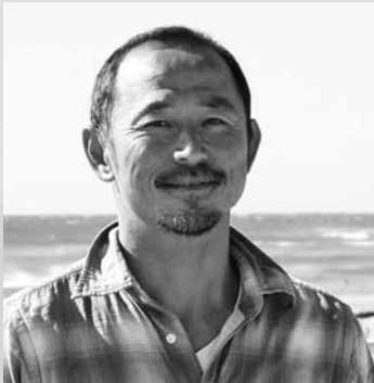
日本ウィンドサーフィン連盟理事長