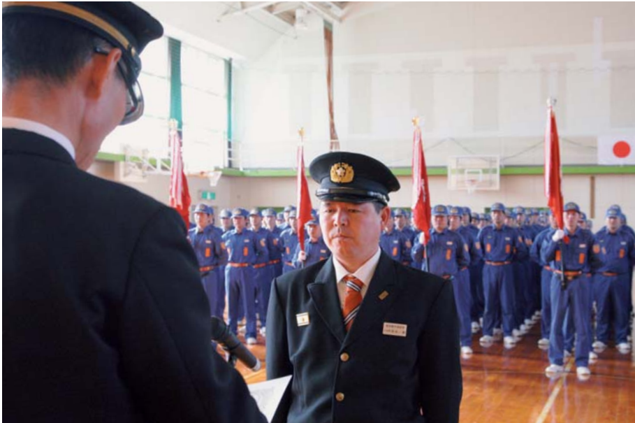
消防活動に功績を残した団員らが表彰された