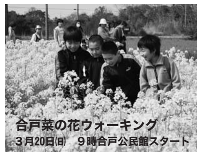
合戸菜の花ウォーキング 3月20日(日) 9時合戸公民館スタート