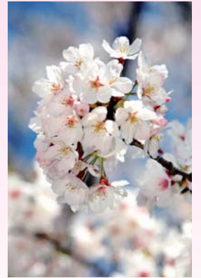
桜咲き誇る 八千代公園