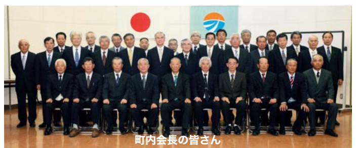
町内会長の皆さん