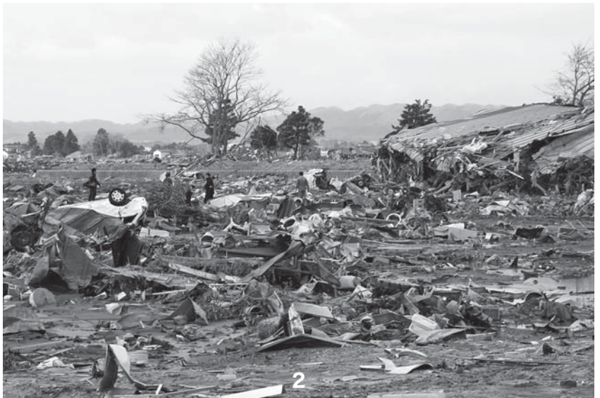
1_津波で家屋が流され、残骸が集積してしまった 2_自宅跡地を訪れる住民 3_津波の威力で街中に船が打ち上げられた 4_地震と津波の威力で壊れた堤防