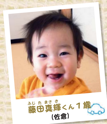
ふじたまさき 藤田真輝くん1歳 (佐倉)