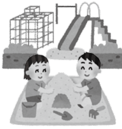
《住みよい街づくりのため》

社会保障の充実や教育の振興、さまざまな公共サービスや公共施設の管理など、毎日を豊かで潤いのある生活にするために使われています。