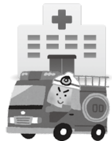
《安全・安心のため》

自然や歴史を守り、生活環境を向上させるため道路や橋、池や公園など社会資本の整備やごみ処理、環境対策に使われています。