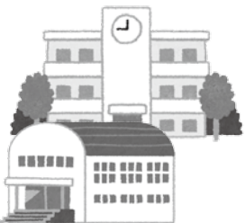
《豊かな暮らしのため》

※収納推進室では文書や電話催告による自主納付を含めて総額約1億円の徴収成果を上げました。