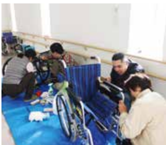
▶車いす清掃のボランティア