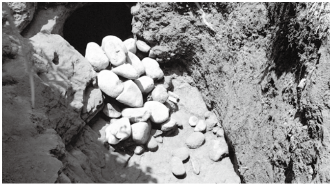
▲穴口横穴の河原石による閉塞状況