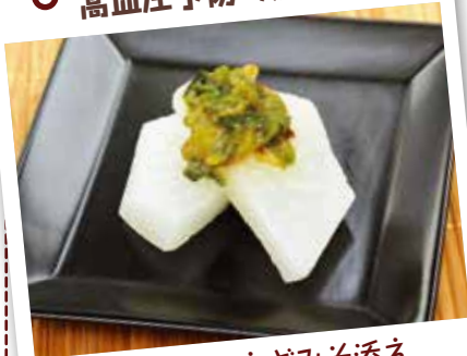
ダイコンのネギみそ添え