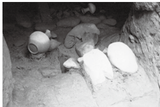
▲玄室内の遺物の出土状況