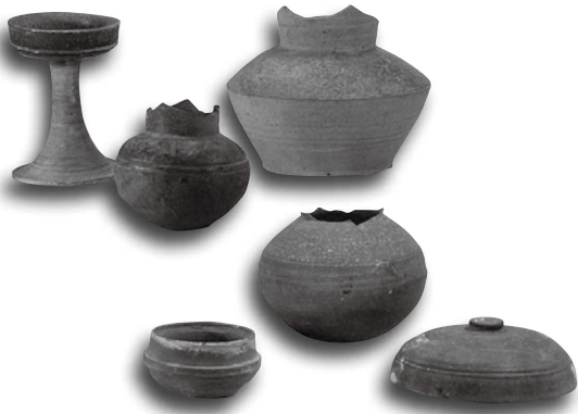
▲郷西横穴群の出土遺物

この横穴群からは7世紀末から8世紀初頭の広口長頸壺が1点出土していますが、それ以外の長脚高坏や2段透高坏、短頸壺、短頸埴、長頸埴などの出土遺物(10点)は6世紀中頃のものであることから、市で最も古い時期に構築された横穴群であると考えられます。