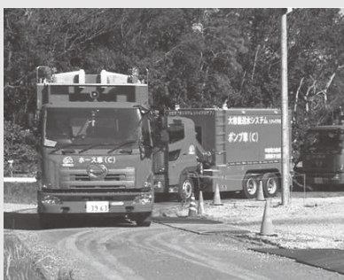
▲可搬型の動力ポンプ

く任務につきます。 中部電力は、7月1日付けで組織改定および業務分担の見直しを行いました。