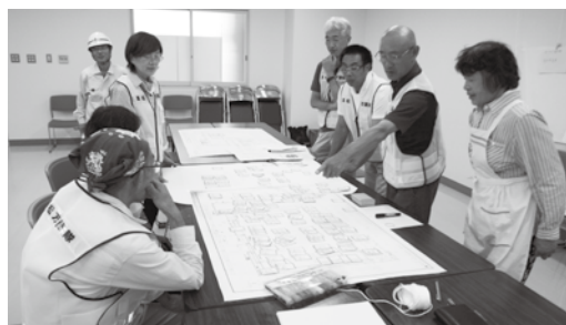
▲昨年の高松方面隊の避難所 HUG の様子

いざというときに慌てず行動するためにも、何をすればよいのか定期的に家族で話し合いの時間を持ちましょう。避難場所や安全な