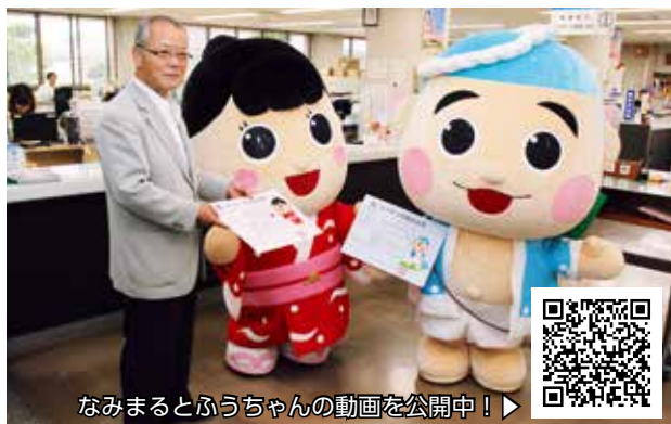
なみまるとふうちゃんの動画を公開中！▶