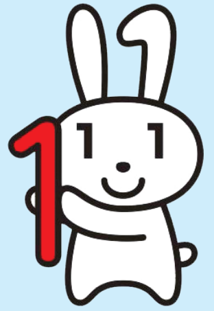
マイナンバーキャラクター マイナちゃん

平成25年5月に「行政手続における特定の個人を識別するための番号の利用等に関する法律」が公布され、マイナンバー（社会保障・税番号）制度の導入が決定しました。平成27年10月からマイナンバーが随時通知され、平成28年1月より、社会保障・税・災害対策の行政手続きでの活用が始まります。