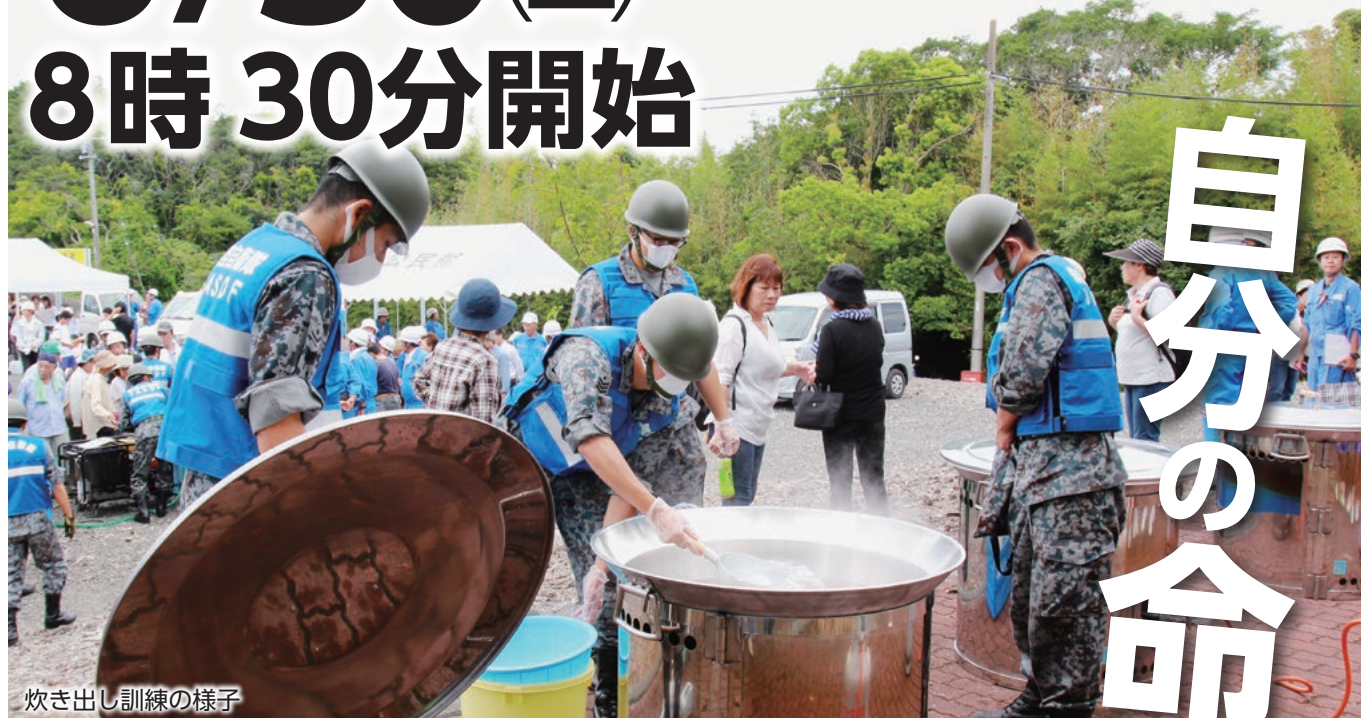
炊き出し訓練の様子