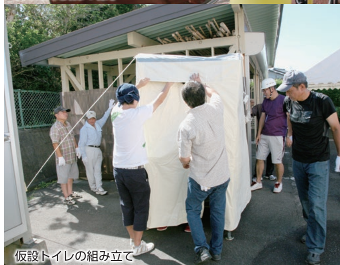
仮設トイレの組み立て