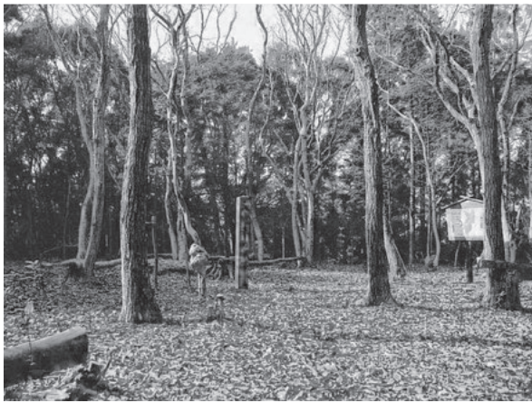
▲八幡平城跡一の曲輪の現状