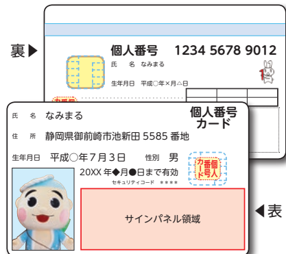
個人番号カードのイメージ