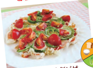
彩り野菜のお餅ピザ