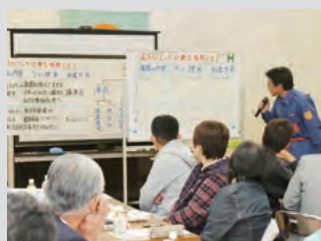
▲意見交換会の様子

原子力に関して本当に市民が必要としている情報は何か議論し、今後の情報発信に役立てるため、市は2月9日、原子力広報研修センターで、町内会長や商工会、農協、消防団、民生委員など各団体の代表者ら36人による「第2回原子力に関する意見交換会」を開催しました。