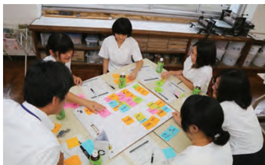
▲漫画版パンフレットを作成してくれた高校生たちは、最初の取り組みとして公共施設の改善点をグループに分かれて話し合いました。