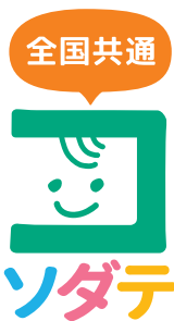
▲全国共通ロゴマーク

※詳細は「しずおか子育て優待カードホームページ」(http://www.pref.shizuoka.jp/kousei/ko-130/yuutai.html)をご覧ください。