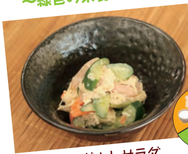
ヨーグルトサラダ