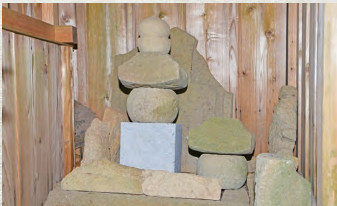
▲社殿内の五輪塔(地輪は後補)