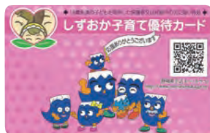
▲しずおか子育て優待カード

18歳未満の子どもの保護者と妊娠中の人を対象に、買い物などの際に提示すると割引などの各種サービスを受けられる「しずおか子育て優待カード」を配付しています。 平成28年4月1日からは、全国の子育て支援パスポート事業の協賛店舗で、しずおか子育て優待カードを提示するとサービスを受けられるようになります。 ※一部の都道府県を除く