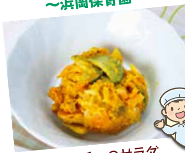
カボチャのサラダ