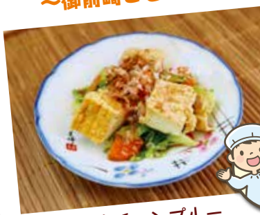
豆腐チャンプルー