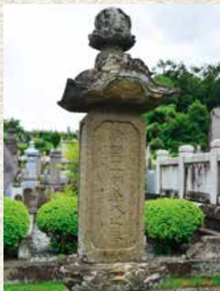
▲新野五郎道氏の墓(八王子市)