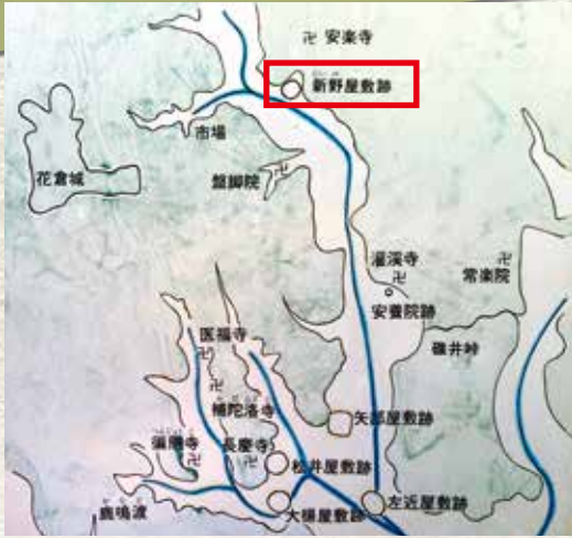
▲花倉付近の地図(長慶寺説明看板から抜粋)