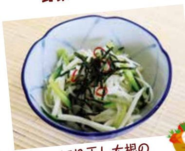
切り干し大根の チーズのり酢