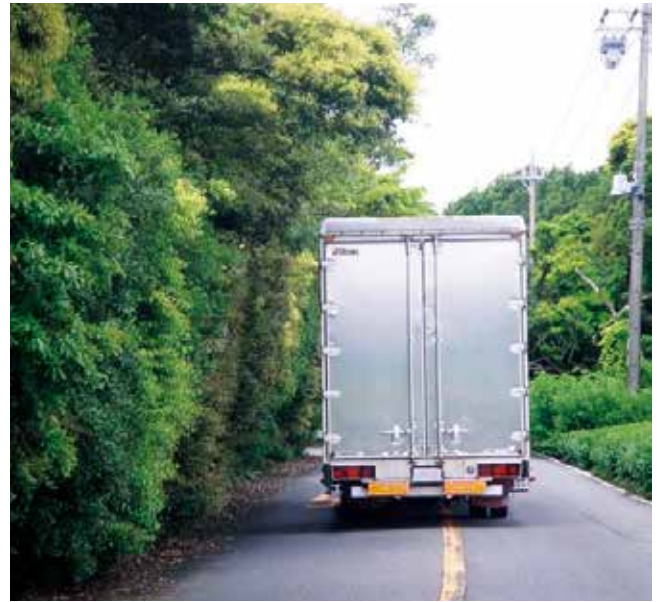
▲道路上に張り出した樹木の影響で、センターラインを越えないと通行できない危険な道路