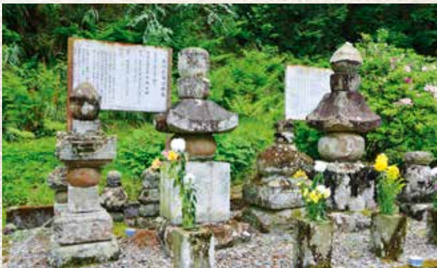
▲遍照寺の範氏・氏家墳墓