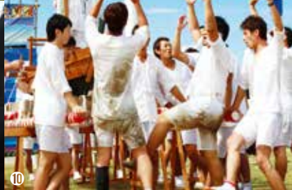
①約5000発の花火が打ち上げられた ②「だっくら丸」を海の中で大きく揺り動かす ③迫力ある「なぶら御前太鼓」 ④開店に向け準備する出店者 ⑤老若男女楽しめる盆踊り ⑥浴衣を着た人々が会場を彩る ⑦フラダンスの衣装に身を包んだ女性たち ⑧ダンスを披露する子どもたち ⑨山盛りのかき氷を笑顔で受け取る ⑩威勢のいい掛け声でだっくらが始まる