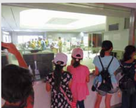
▲説明を聞いてから発電所を見学

市は原子力に対する正しい知識と理解を深めてもらうようと、「こども発電施設等見学会」を8月10日に開催しました。 この見学会は、平成16年度から毎年開催しており、参加者は原子力発電と火力、水力発電との発電方法や仕組みの違いについて学んでいます。 今年も、市内の小学4～6年生とその保護者、中学生の計32人が参加し、三重県の「川越火力発電所」と「川越電力館テラ46」を見学しました。