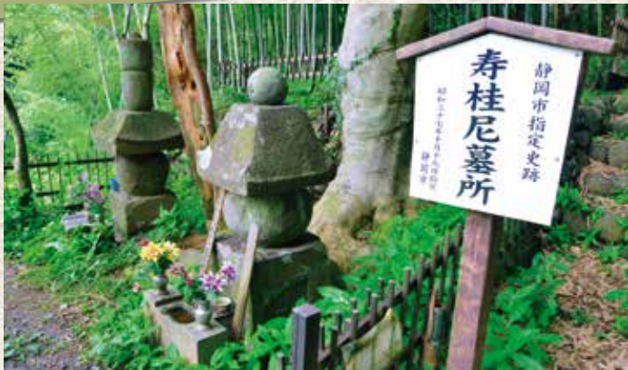
▲寿桂尼墓所（手前が寿桂尼の五輪塔）