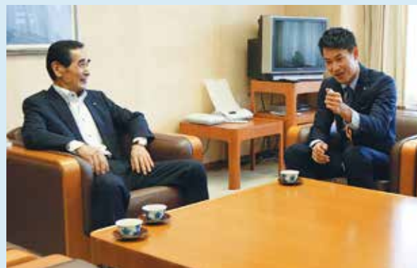
▲今大会の銅メダル獲得の喜びを話すとともに、東京オリンピックについての抱負を語りました。

いました。しかしながら、個人種目において決勝の舞台に立つことはできませんでした。次は立てるよう努力していき、パワーを与えるられる選手になっていきますのでこれからもご声援よろしくお願いたします。メダルと一緒に皆さまとお会いする機会を楽しみにしております。