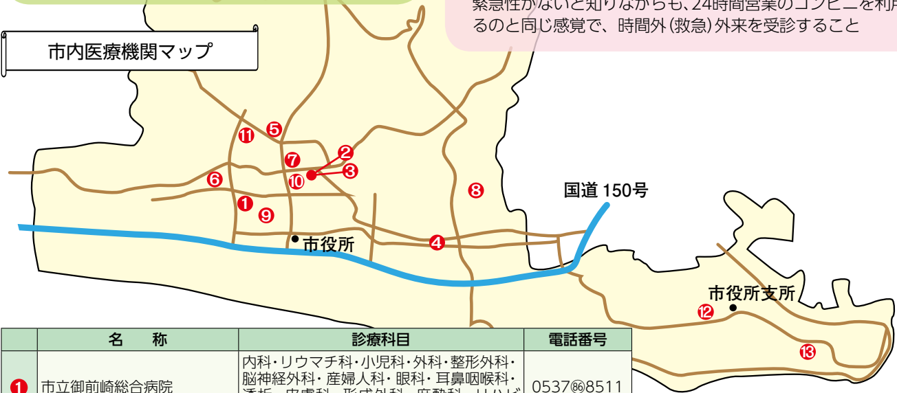
市内医療機関マップ

緊急性がないと知りながらも、24時間営業のコンビニを利用するのと同じ感覚で、時間外(救急)外来を受診すること