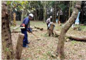
▲八幡平整備の様子