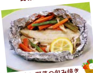
魚と野菜の包み焼き