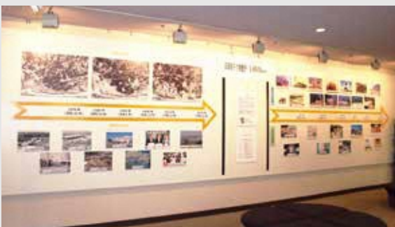
▲原子力館に展示されている「50年のあゆみ」

返るとともに、今後の原子力発電を含む日本のエネルギー事情についてあらためて考えてみてはいかがでしょうか。 ※1974年(昭和49年)に制定された「電源開発促進税法」特別会計に関する法律「発電用施設周辺地域整備法」の3つの法律を基にした、地域振興や福祉向上を目的とする交付金。