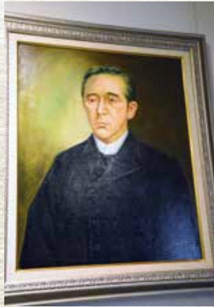
▲関口隆吉肖像画 (池宮神社蔵：樽林靖男氏画)