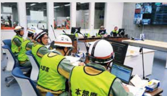
▲本部運営訓練の様子(新緊急時対策所)

水設備の操作訓練やホースブリッジの設置訓練、放射線モニタリングに用いるマルチコプターの操作訓練などが実施されました。 訓練が実施された新緊急時対策所は、平成29年3月に建物部分が完成し、従来の建物と比べ耐震性や電源機能、放射線の遮へい性などが強化されています。