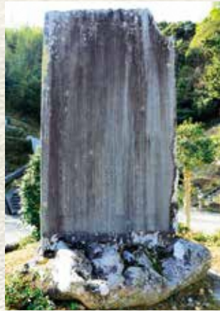
▲関口隆吉の顕彰碑 (明治25年1月建立)