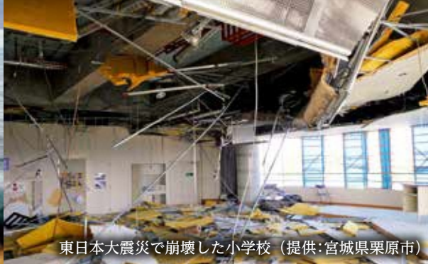
東日本大震災で崩壊した小学校