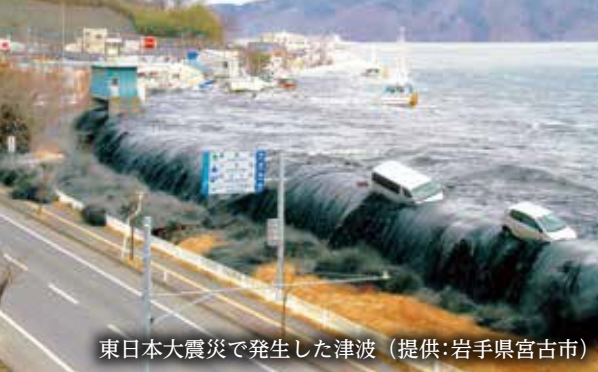
東日本大震災で発生した津波