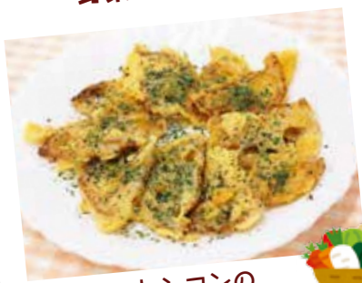
レンコンの かりかりチーズ焼き