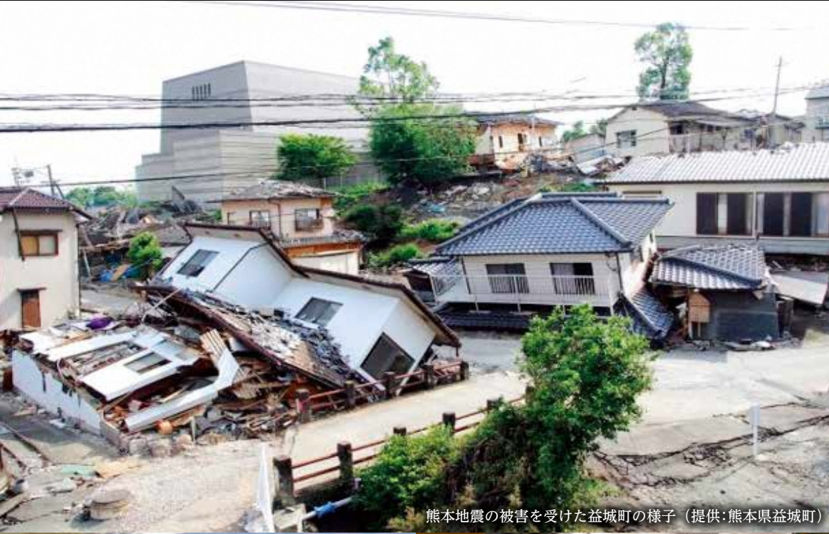
熊本地震の被害を受けた益城町の様子